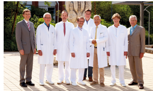
Das kompetente Leitungsteam der Kreisklinik (v.l.n.r.):